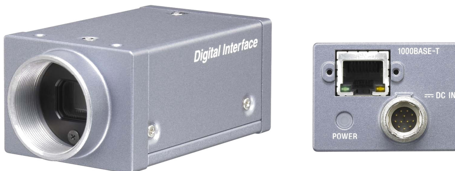
第 1 図 『XCGシリーズ』 「XCG-5005E」「XCG-U100E」 「XCG-SX97E」「XCG-V60E」 (筐体は4モデル共通サイズ)