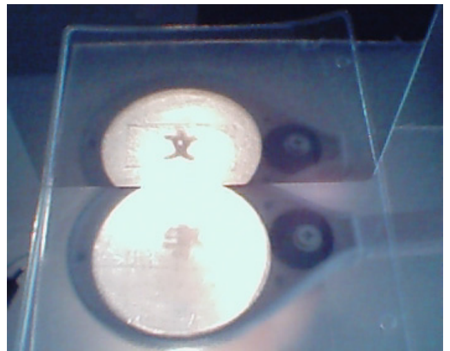
写真3 凸レンズ方式による表示領域の拡張