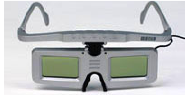
写真1 液晶シャッタメガネ