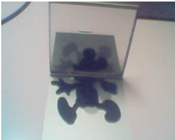
写真2 変更利用方式による表示領域の拡張