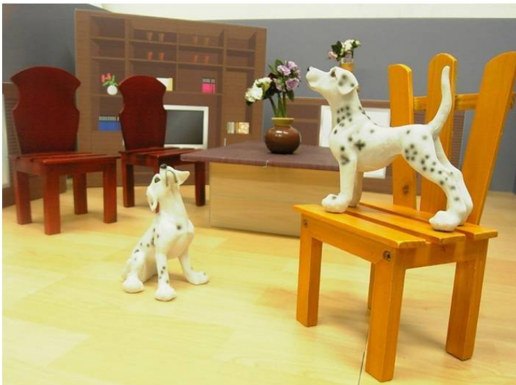
(a) デジタルカメラ画像