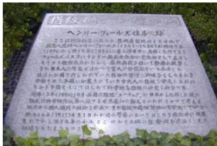
第 6 図 「指紋研究発祥の地」の石碑