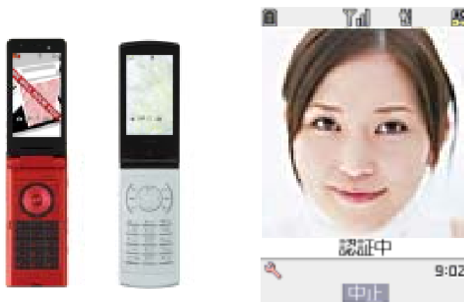
第 2 図 顔認証機能を持つ携帯電話の例 (左が N905i、中央が N905iμ、右は認証時の画面例)