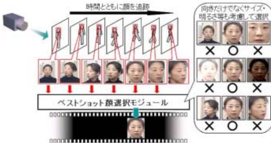
第 2 図 ベストショット顔画像選択技術：顔のサイズ・明るさ・向き等を考慮して，顔認証などの後処理に最適な画像を選択する技術