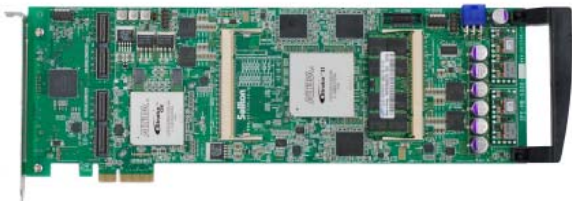
第 4 図 ExpressoFPGA (エクスプレッソ・エフピージーイー)