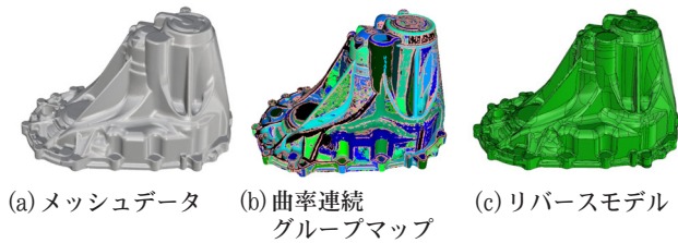
第 2 図