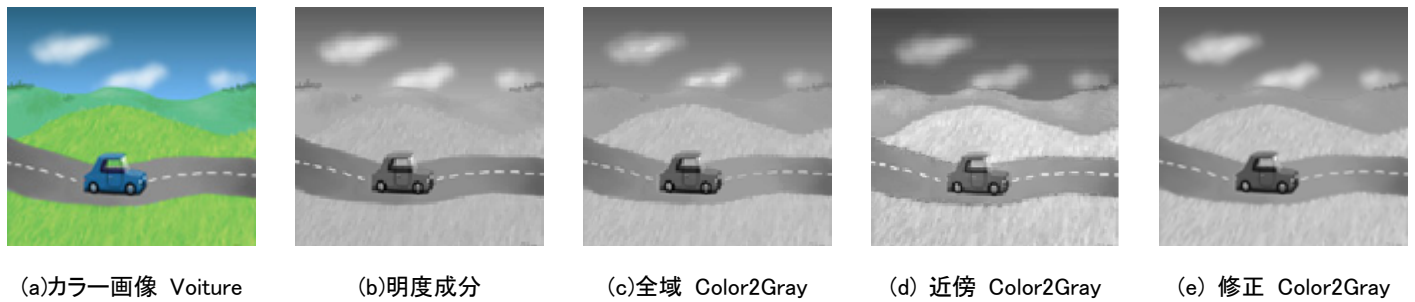
第 6 図 Voiture に対する実験結果