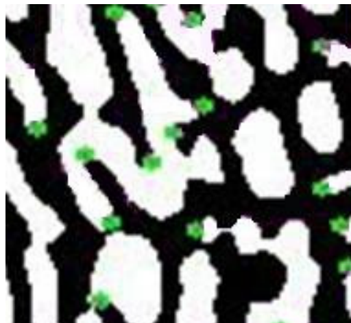
第4図 2値化画像に対する特徴点検出結果