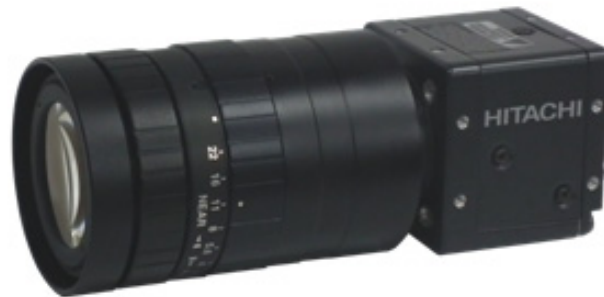
写真1 400万画素CMOS カメラ