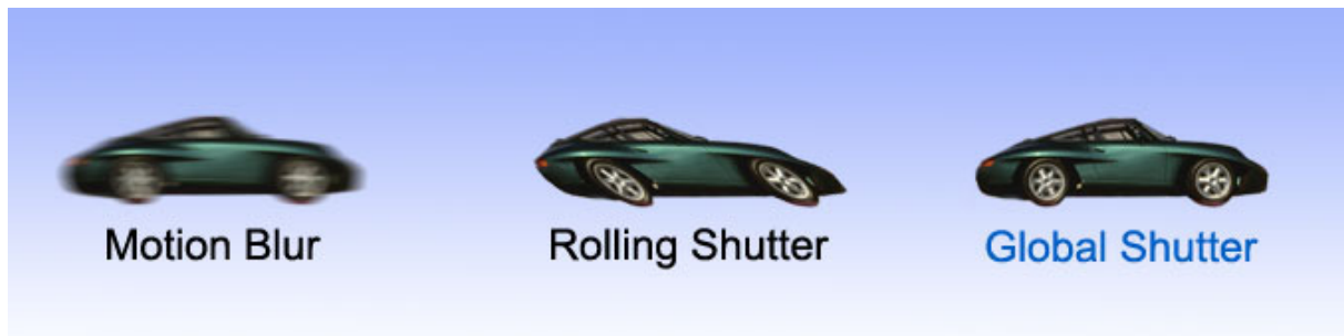
第3図 被写体ブレ、ローリングシャッターによる歪み、グローバルシャッター