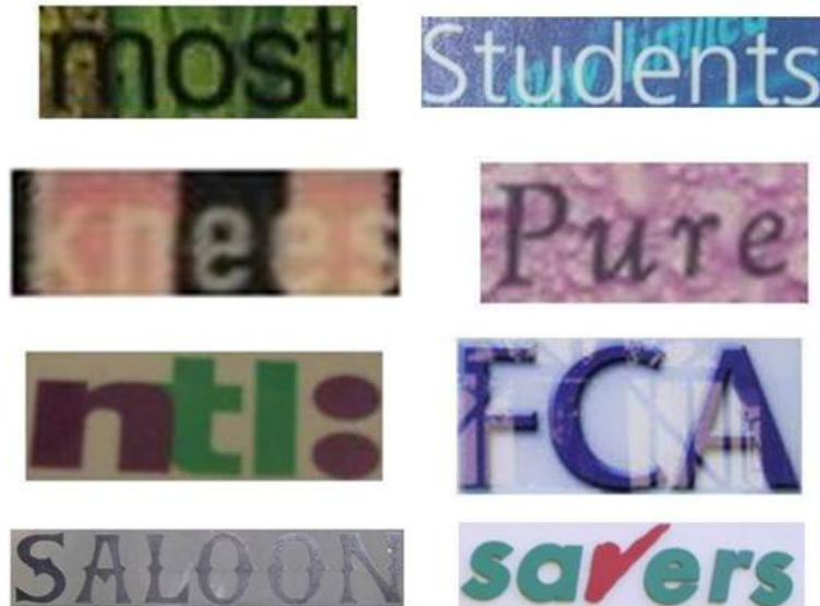
第1図 2値化実験に用いた画像例