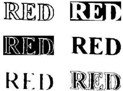
(b) 2 値化文字列の候補画像例