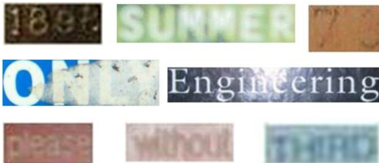
第6図 正しい2値化文字列画像が生成できなかった画像例