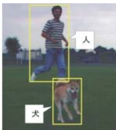
(b) 事物を囲む矩形領域に対する記述