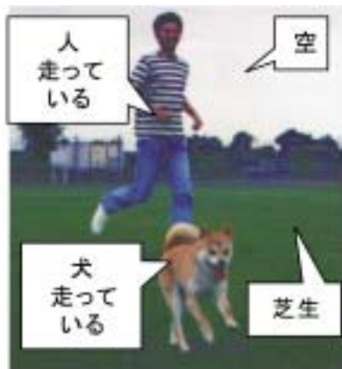
(a) 通常の写真と一般名詞・動詞によるタグ