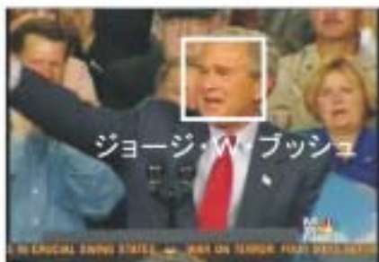
(b) 有名人によるタグ (TRECVID より)