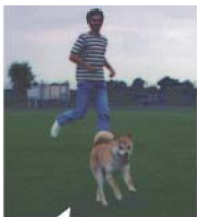
(a) 画像・映像セグメントに対する記述