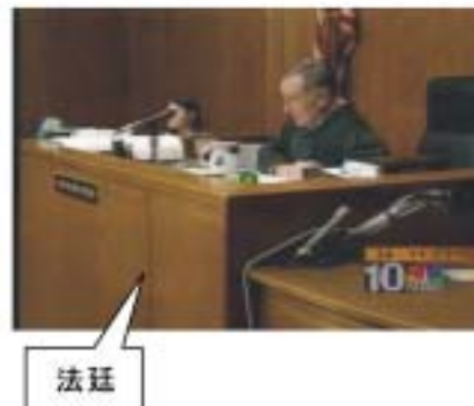
(c) 情景によるタグ (TRECVID より)