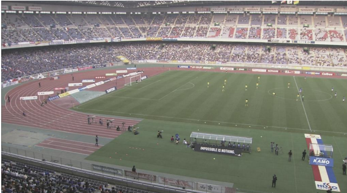
第4図 左ビデオカメラによるサッカー動画像データの画像例