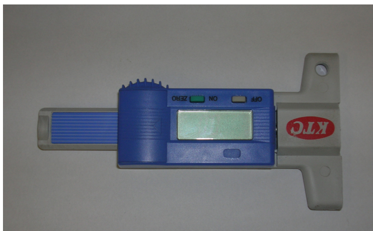
第7図 溝計測ゲージ