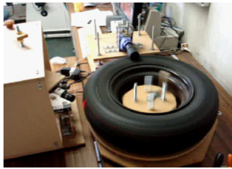
第3図 溝計測システム全体像