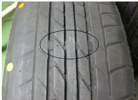
第5図 スリップサイン