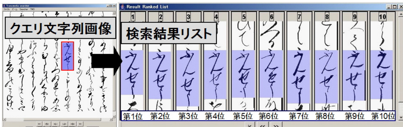
第3図 検索アプリケーション