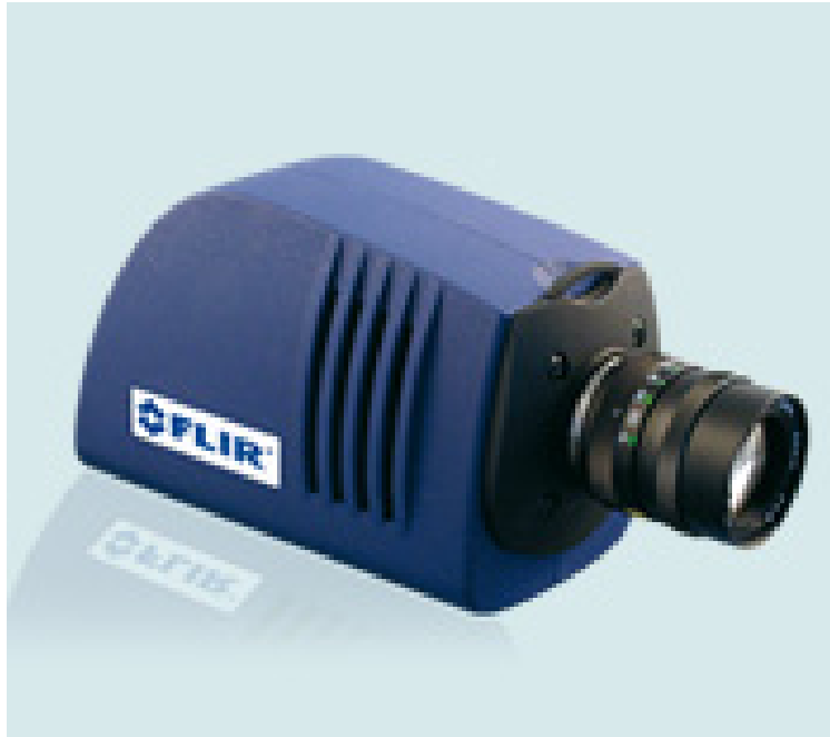
写真1 近赤外線カメラ SC2200