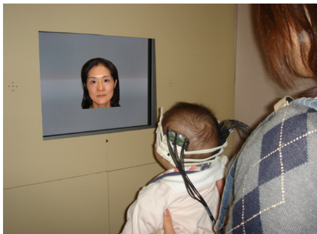
第 2 図 顔を見ている時の乳児の NIRS 実験の様子