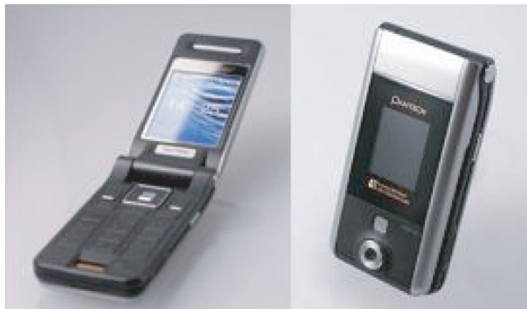
第14図 肌診断ソフトウェアが搭載された携帯電話