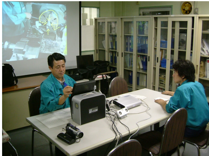
第7図 映像機器を使用して熟練技能者が若手技能者に技能を教える様子