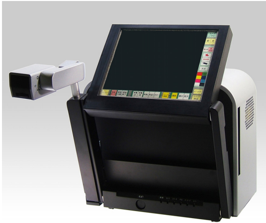
第1図 実験で使した映像装置