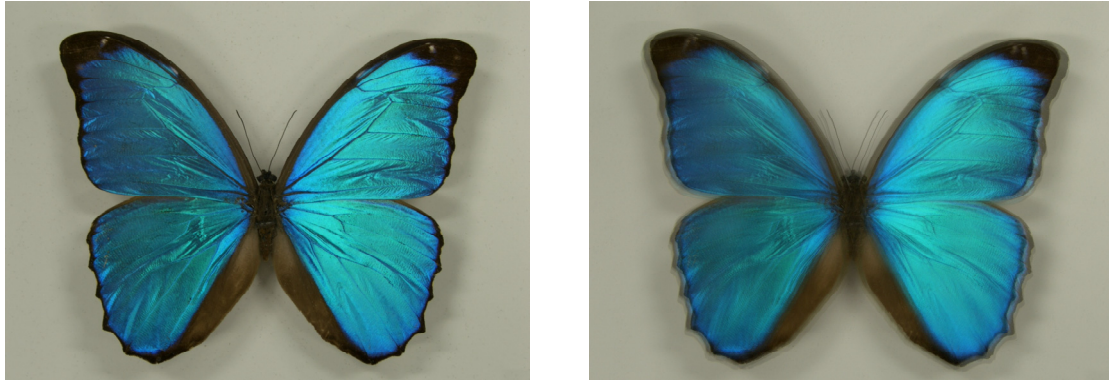
第 1 図 手ブレのない写真(左)と手ブレした写真