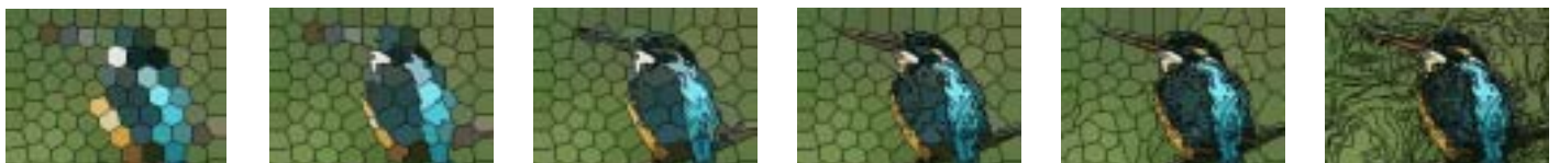
第 3 図 = 0, 0.2 \dots, 1 での画像分割の例