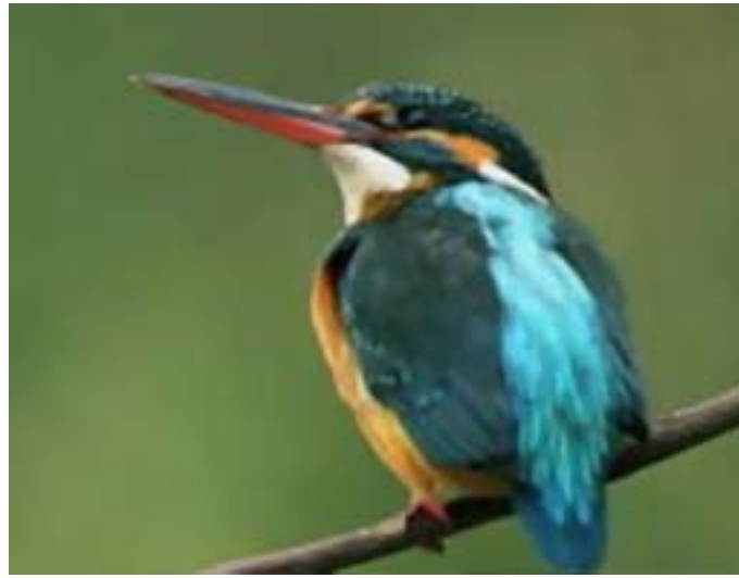
第 1 図 かわせみの画像