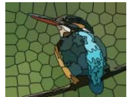
第 4 図 BCVT による第 1 図の画像分析