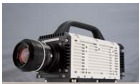
第4図 MEMRECAM GX-1