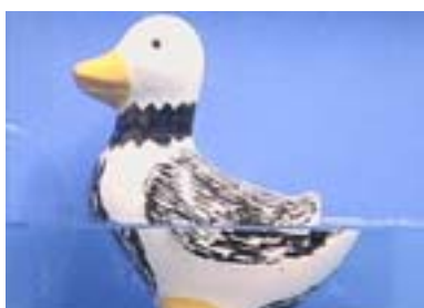
(a) 原画像 (水面付近を撮影)