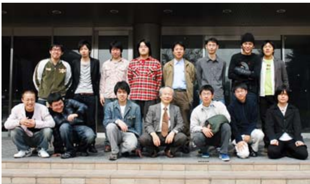
第 1 図 研究室メンバー (2007 年 4 月撮影)