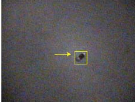
第 3 図 追跡結果 (dark 1)