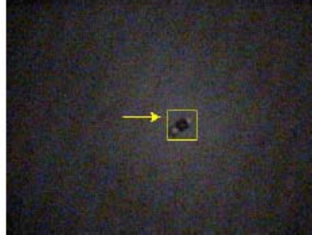
第 4 図 追跡結果 (dark 2)