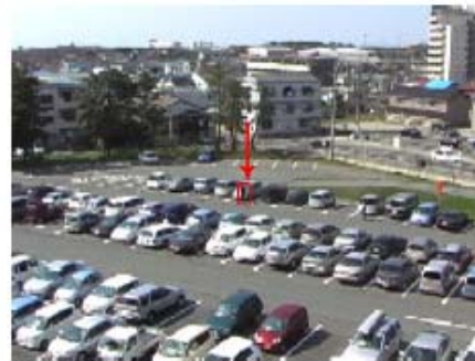
第 3 図 追跡結果 (parking 2)