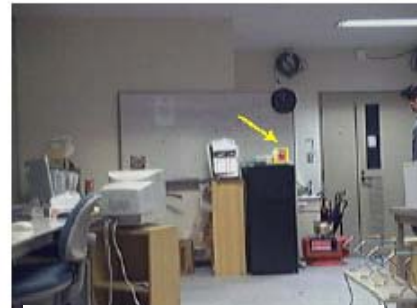
第 7 図 追跡結果 (ball 2)