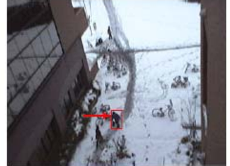
第 5 図 追跡結果 (passing)