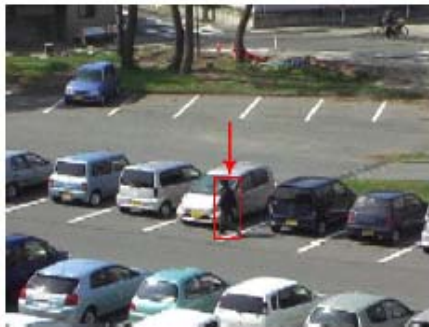
第 8 図 追跡結果 (parking 1)