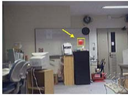
第 6 図 追跡結果 (ball 1)