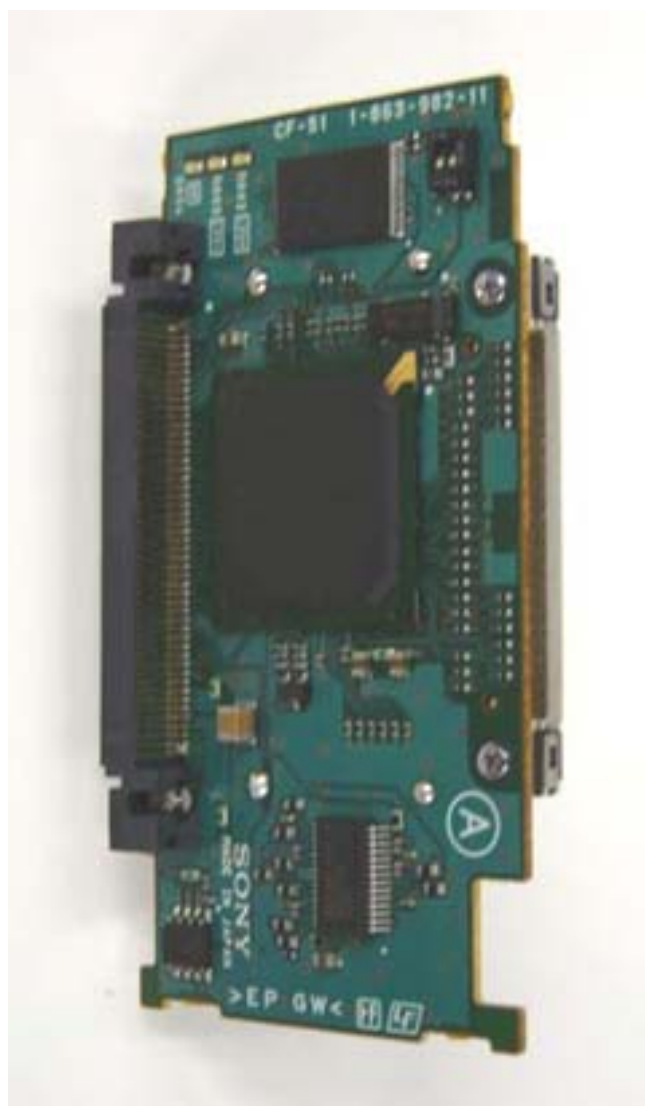
写真3 サウスブリッジとコンパクトフラッシュ