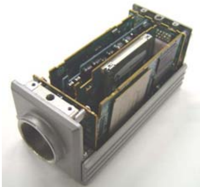
写真2 XCIシリーズ内部基板構成