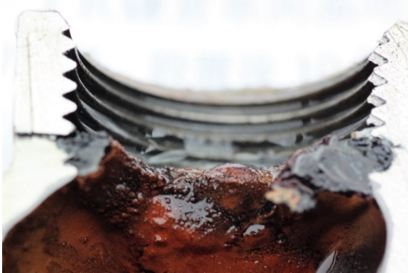
写真1 継手部の断面