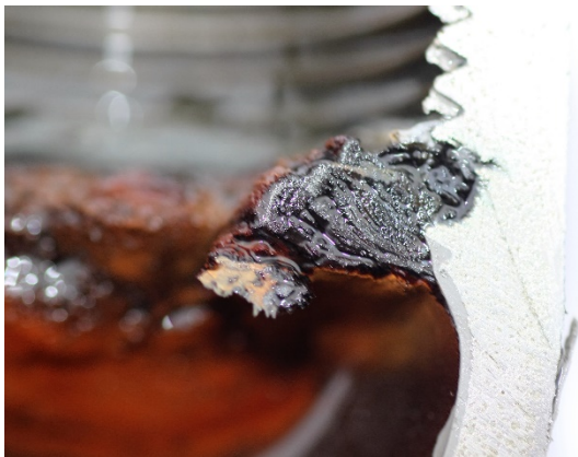
写真2 ねじ山部分の拡大