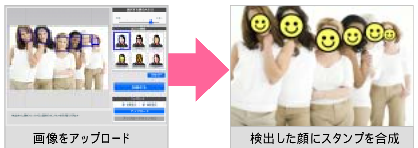
第 5 図 顔ラボの体験アプリ 「顔シークレット」