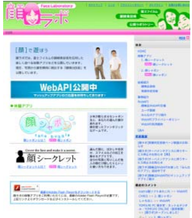
第 3 図 「顔ラボ」サイト ( http://kaolabo.com/ ) トップページ