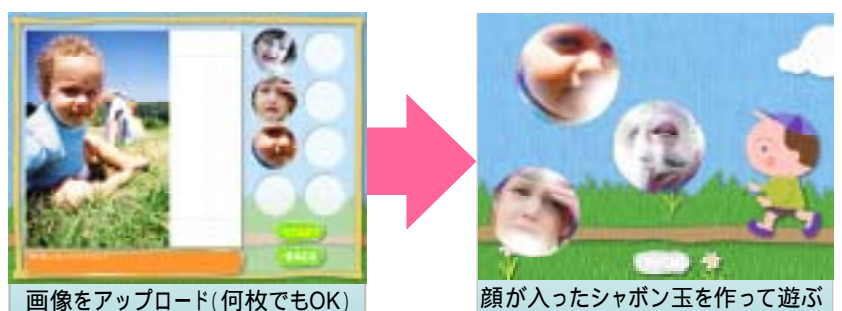
第 6 図 顔ラボの体験アプリ 「顔シャボン」