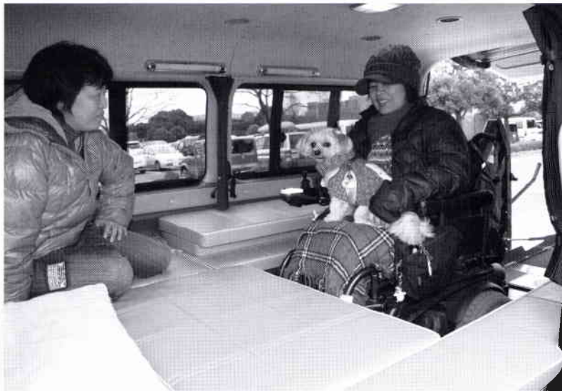
写真の車両はトヨタのハイエース。もちろん、ミニバンでも可能です