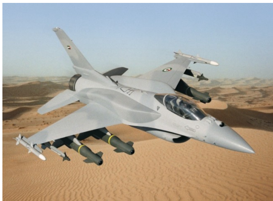
写真3 先端監視システム