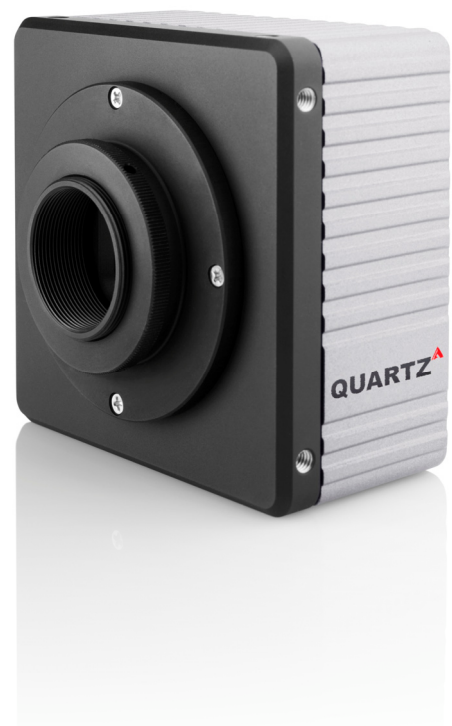
写真6 True Accurate Imagingを採用した QUARTZシリーズ