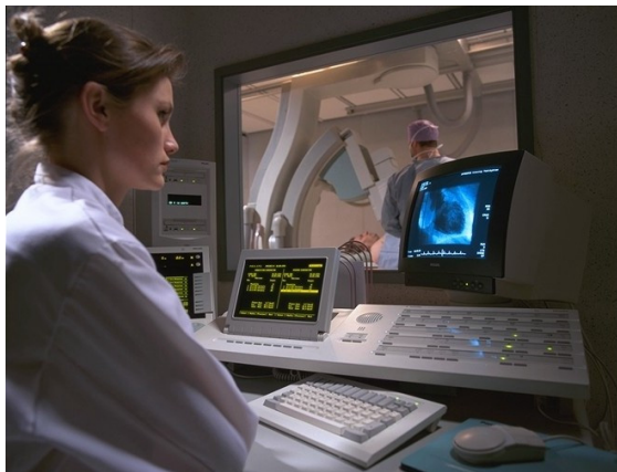
写真1 工業用カメラ