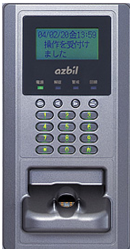
第1図 指紋認証装置