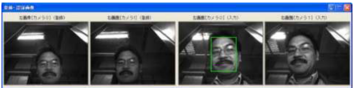
[登録ステレオ画像]