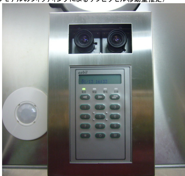
第5図 プロトタイプ ユーザーインターフェース部 (ステレオカメラ, LCD、テンキー、 人感センサ付き照明)