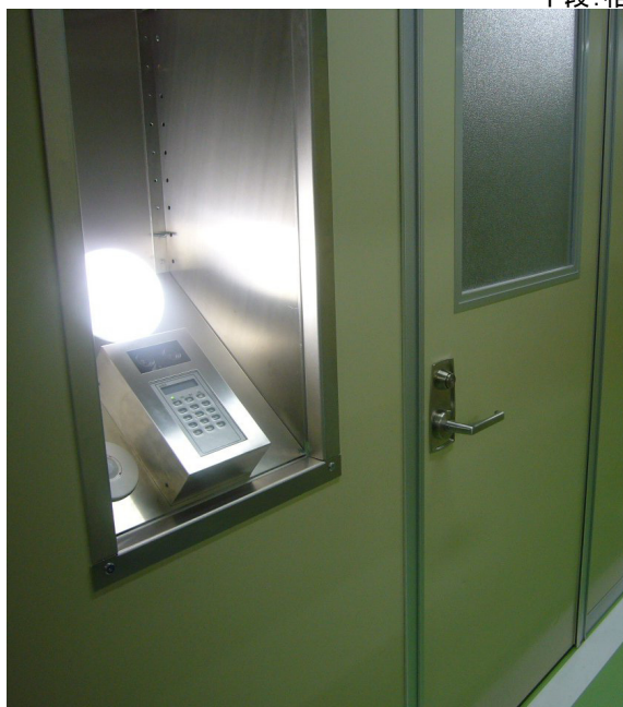
第4図 プロトタイプ外観