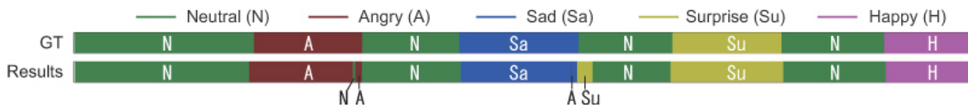
(c) 正解ラベル（上段）及び認識結果（下段）。横軸は(b)と一致