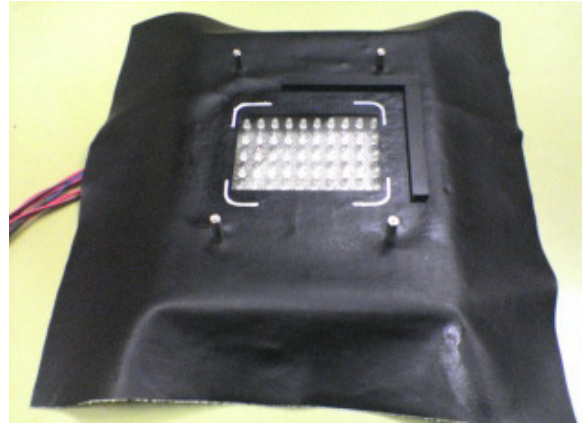
第 4 図 近赤外 LED アレイ照明装置