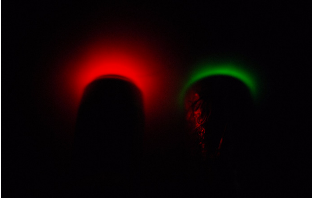
第1図 690nm(RED)レーザーと532nm(GREEN)レーザーのヒト皮下組織からの散乱光