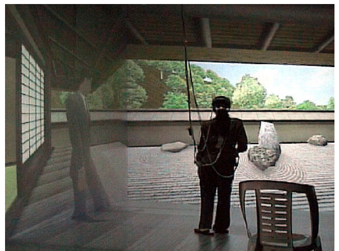
第4図 仮想の「場」を共有する通信システム