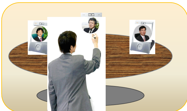
第3図 代理参加型の遠隔会議の実現イメージ