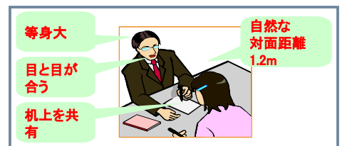
第2図 対面空間を共有する通信システム Tele-Face