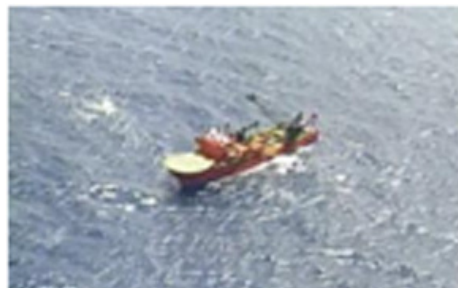
第 2 図 スポットライト画像の例