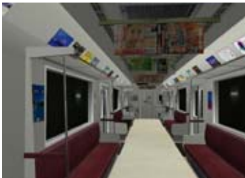
(a) 電車内の混雑度 0 段階