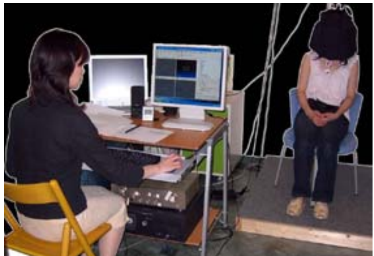
第 4 図 本コンテンツを利用した治療の様子