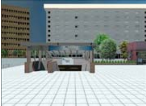
第 1 図 駅の入り口

不安や恐怖治療のため開発された VR エクスプローラーコンテンツ 早稲田大学 / 李 在麟・河合隆史・吉田菜穂子・井澤修平・野村 忍