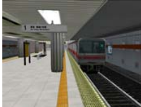
第 2 図 患者の始点から見る電車の到着様子