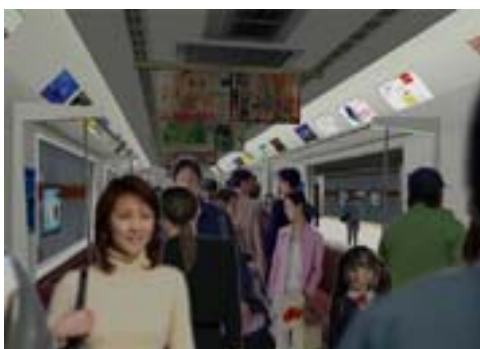
(b) 電車内の混雑度 1 段階