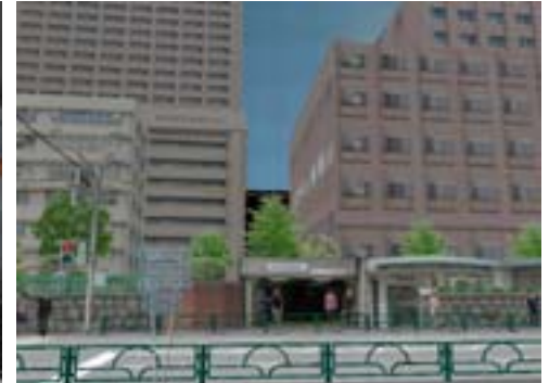
第 3 図 終着駅外の様子