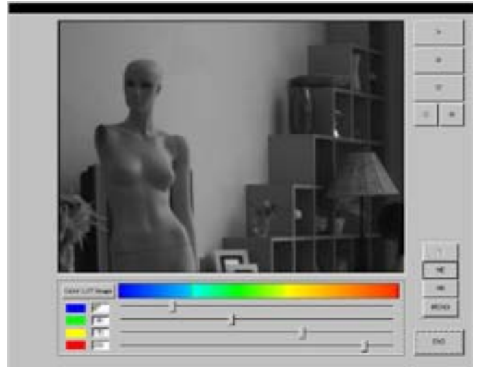
第 7 図 紫外線可視化画面イメージ