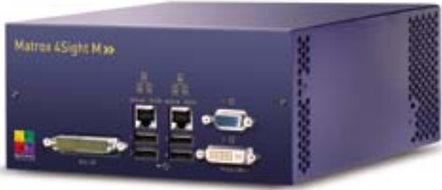
第 6 図 4SightM 本体

ダイトエレクトロン(株) / 山畑和紀 ソニー(株) / 奥平康博 キヤノンシステムソリューションズ / 稲山一幸