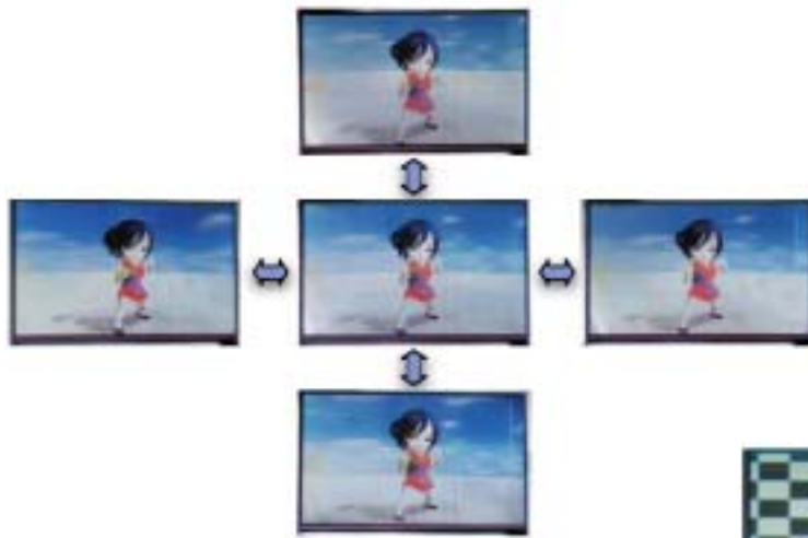
第 4 図 試作ディスプレイでの運動視差