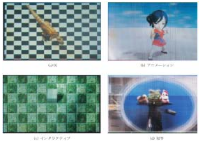
第 4 図 コンテンツ例