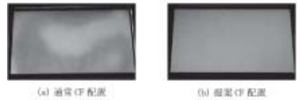
第 5 図 色もあれの比較