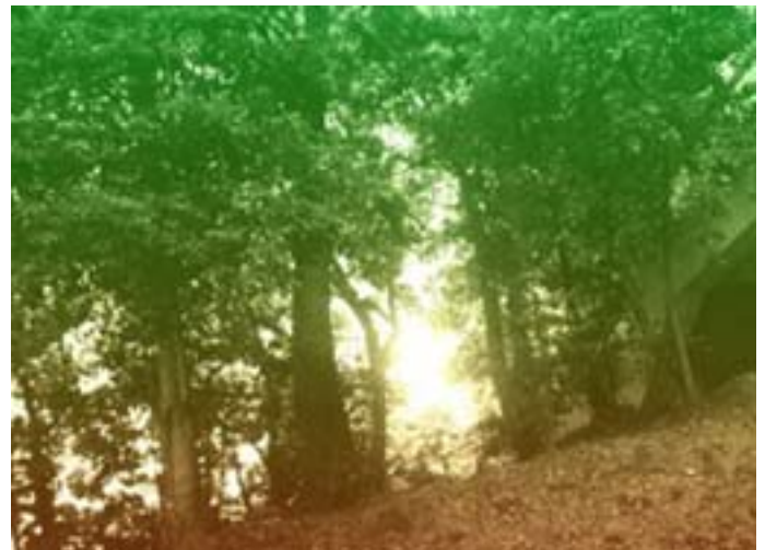
第 4 図 PGBチャンネルごとに異なる値を付加して改良した結果