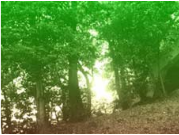
第6図 共分散行列の第一固有ベクトルの調整による結果像