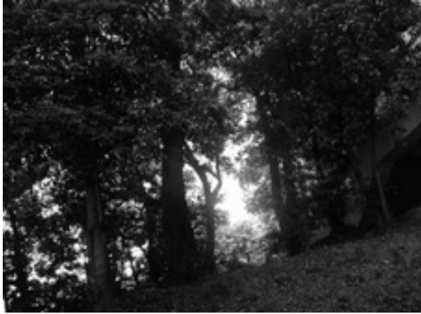
第 1 図 目的画像