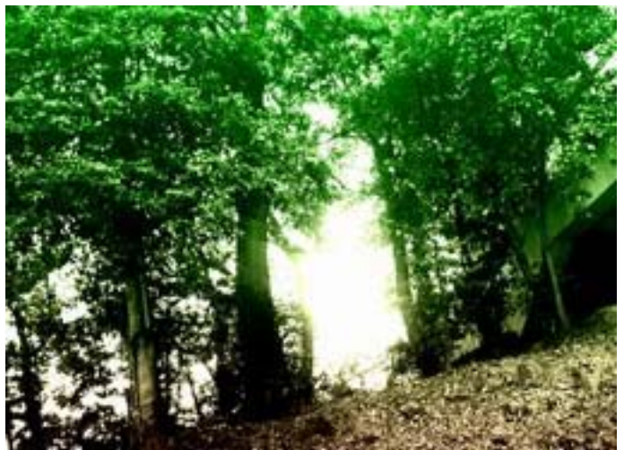
第9図 第一固有値を0.1倍にしたカラー結果