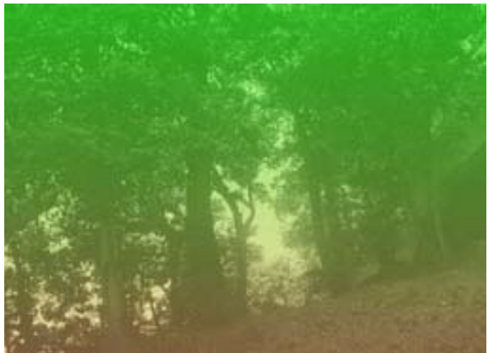
第8図 第一固有値を10倍にしたカラー結果