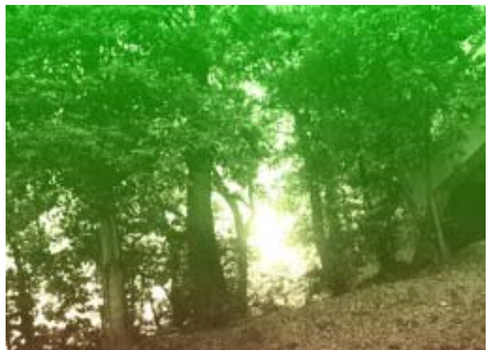
第 5 図 部分画像に乱数表を加えて改良した結果