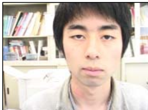
第 5 図 発話動画像の一例