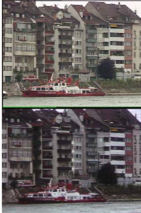
第 1 図 上：オリジナル映像 下：再撮映像

NHK 放送技術研究所 / 合志清一・中村晴幸 三菱電機(株) / 藤井亮介・伊藤 浩・鈴木光義 三菱電機エンジニアリング(株) / 高井重典・谷 愉佳里