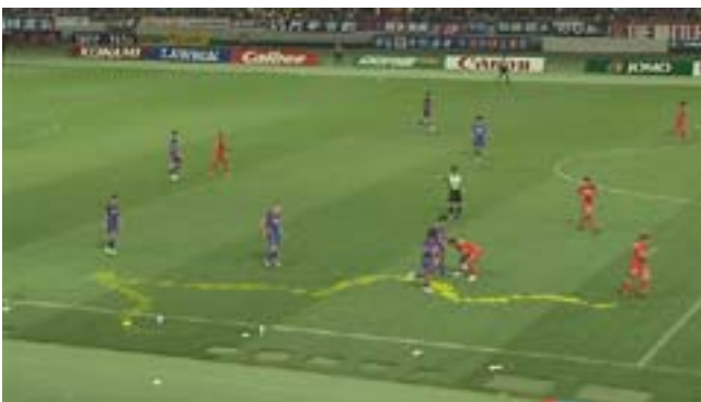
図 9. 特定選手の移動軌跡の可視化