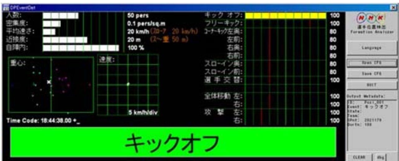
図 12. キックオフイベントの検出画面