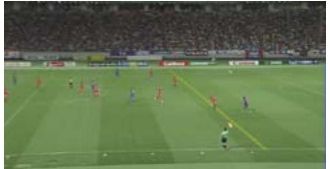
図 7. OLM の出力合成画像