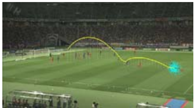
図 10. ボールの 3 次元軌跡