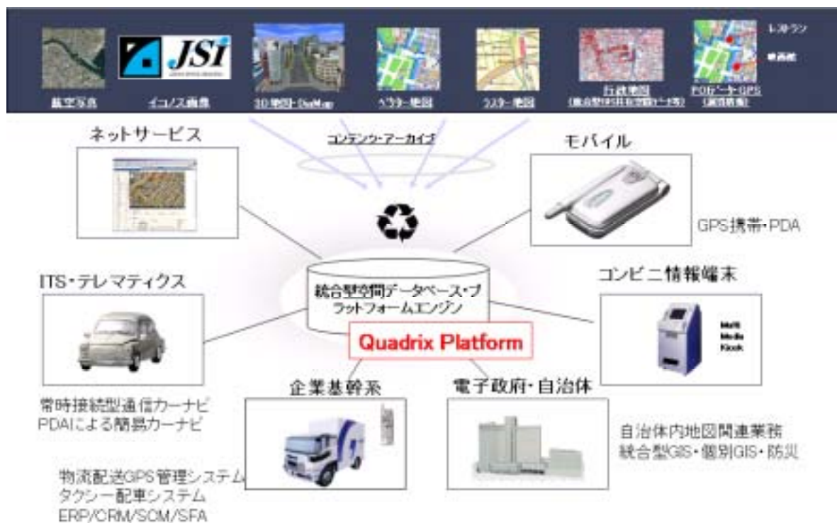
第 1 図 ジクーデータシステムが提供するソリューション概略図