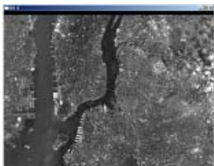
第 2 図 オリジナル画像